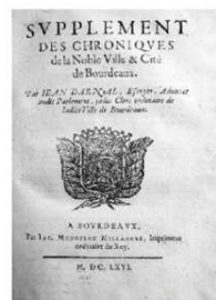
Chronique bordelaise de Darnal