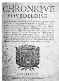
Chronique bordelaise de de Lurbe