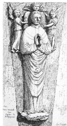
Pierre tombale dans l'église de Blésignac, eau-forte de Leo Drouyn (1888)