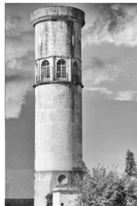
Le château d'eau Le Corbusier