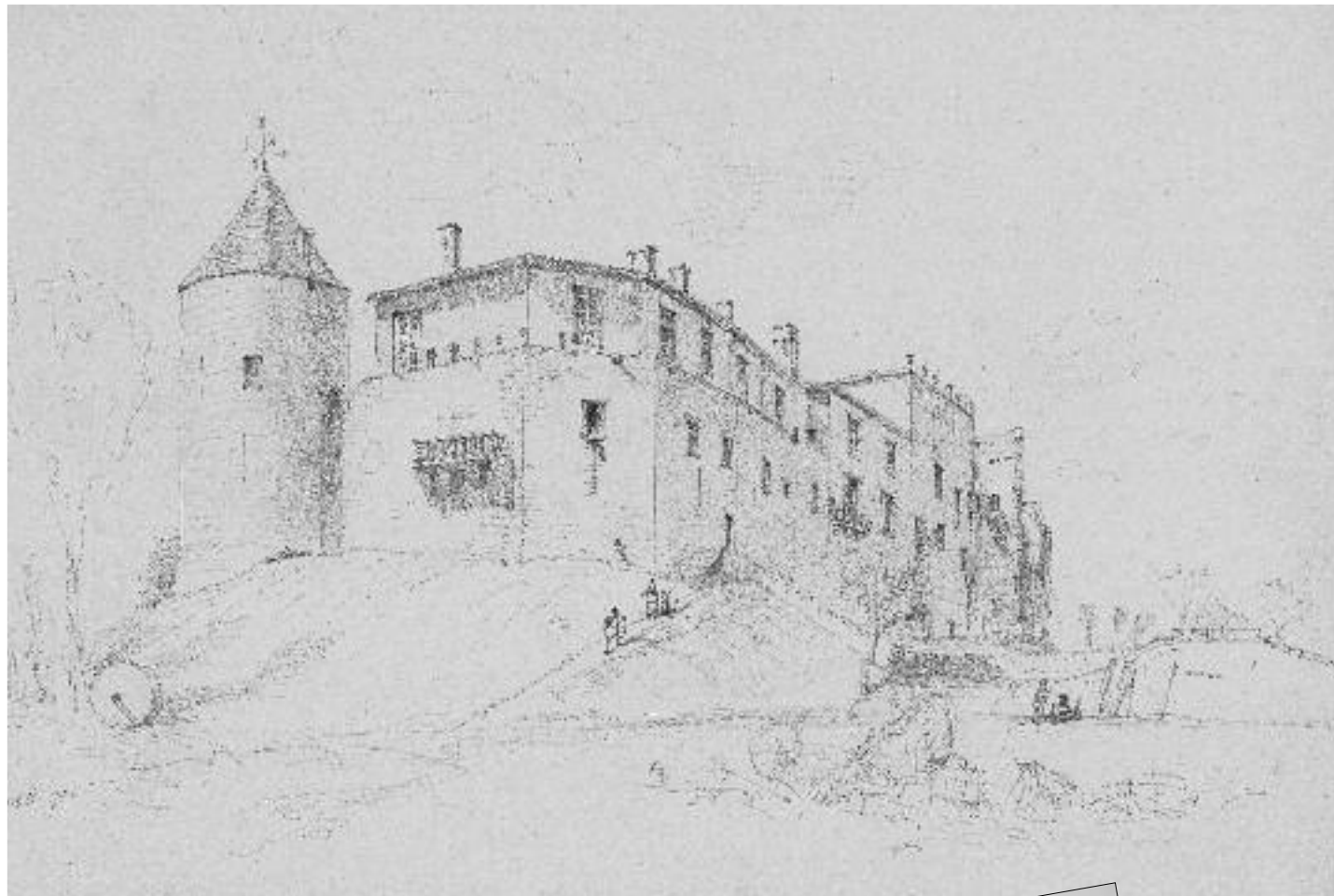
Dessins du château de Benauge par Leo Drouyn